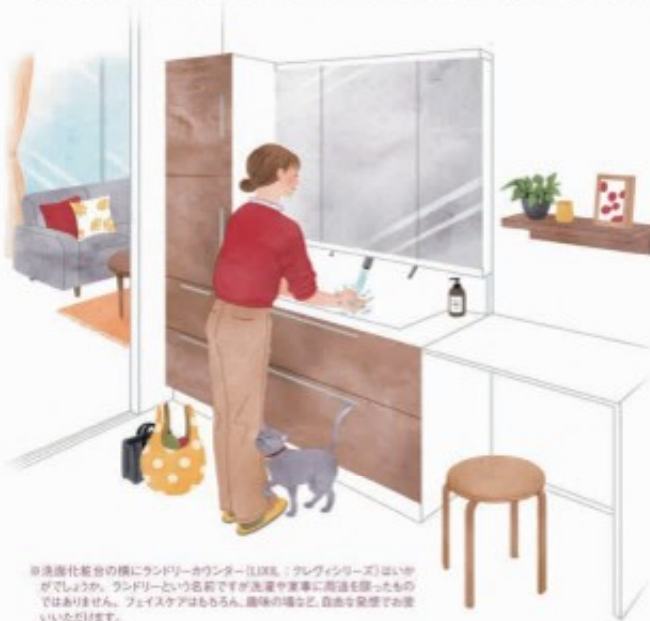
洗面化粧台の横にランドリーカウンター(LDL)・ヘアワシリアイスは、いかがでしょうか。ランドリーといふ名前ですが洗濯や家事に両道を使ったものではありません。フェイスケアはもちろん、歯磨きなど、自由な発想で楽しいアイデアです。

本格的な洗面化粧台ではなく、シンプル、小ぶりの2つ目の手洗器です。手軽に施工でき、比較的低価格で設置できるのも魅力です。