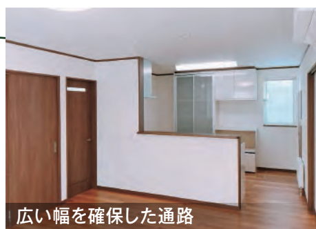
広い幅を確保した通路