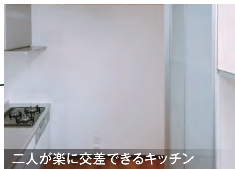
二人が楽に交差できるキッチン