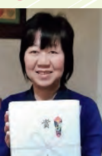
北広島市松葉町 M様

エルム建設では工事終了後、工事をさせていただきましたお客様を対象に、アンケートを実施しております。アンケートにご協力いただきました方全員に、もれなく500円分のQUOカードをお送りしております。さらにWプレゼントとして、抽選で今回は3名の方に「エルムおたのしみ箱」をプレゼントさせていただきました。皆様からいただきましたお声を励みに、今後とも信頼に応えられますよう努力して参りますので、何卒よろしくお願い申し上げます。