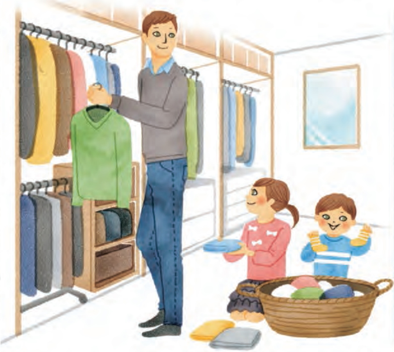
家族みんなで使うファミリークローゼットなら、みんなの衣服や持ち物の状況がひと目でわかります。広めのウォークインクローゼットが最適。

家事をするのは女性、ほかの人は「お手伝い」という感覚はもう古いかもしれません。家事は「家族みんなで協力してするもの」という、家事シェアの考え方を取り入れてみませんか。家事をシェアする効果は女性の仕事を減らして楽にするだけではありません。チームワークは家族のコミュニケーションを深めるためにも大いに役立ちます。普段から家庭で役割を担うことは、お子さんにとっては自立心を養い、生活力を身につけるための第一歩にも。また、リタイア世代には生活のメリハリにもつながります。家事を通して新しい趣味に目覚める熟年世代も多いとか。