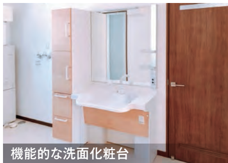
機能的な洗面化粧台