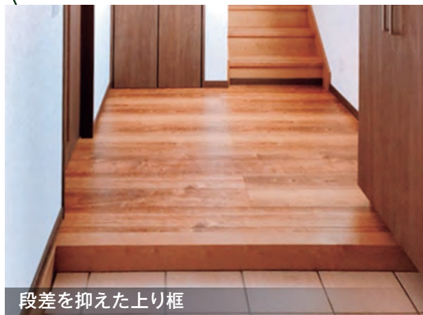
段差を抑えた上り框