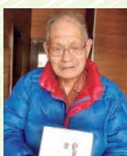
北広島市北進町 I様