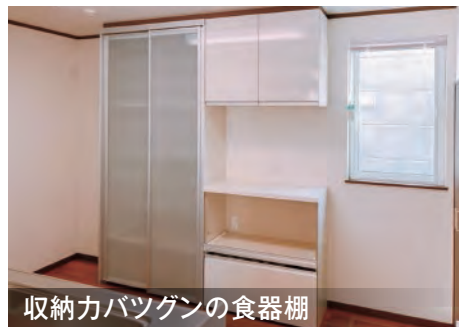
収納力バツグンの食器棚