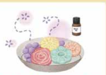
アロマオイルを垂らして使うストーンや、スティックから香りが広がるリードデフューザーなど、見た目も楽しめるものを。

香りには好みがありますが、家族の苦手な香りは避け、みんなが心地よく過ごせるものを選ぶのがベスト。おすすめは、すっきり爽やかなミント系の香りや、せっけんなどの清潔感のあるもの。インテリアのテイストにあわせるのもいいですね。