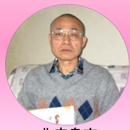
北広島市 朝日町 N様