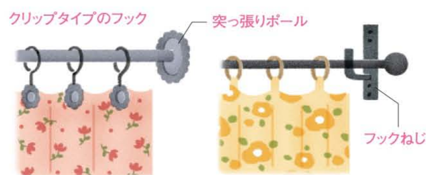
簡単にカーテンを設置したいなら突っ張りポールがおすすめです。難しい場合は壁にフックねじを取り付けてポールをひっかけるスタイルに挑戦してみましょう。

手持ちのお気に入りの布を区切りアイテムとして活用したいときには、クリップタイプのフックが便利。縫い直したりすることなく、クリップで布をとめるだけでポールの下に下げることができます。