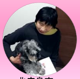
北広島市 共栄町 T様

エルム建設では工事終了後、工事をさせて頂きましたお客様を対象に、アンケートを実施しております。アンケートにご協力頂きました方全員に、もちろん500円分の図書カードをお送りしています。さらにWプレゼントとして、抽選で今回は4名の方に『エルムおたのしみ箱』をプレゼントさせて頂きました♪