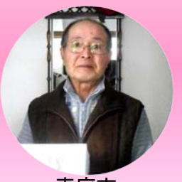
恵庭市 恵み野 K様