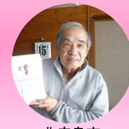
北広島市 広葉町 S様