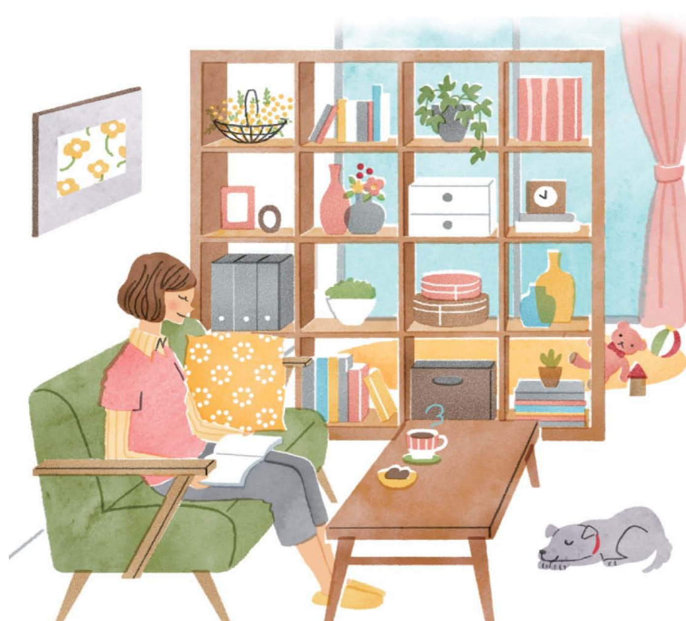
リビングなどの広い空間に存在感のある飾り棚をプラスすれば、便利な収納スペースとしても活躍します。グリーンなどをセンスよく配置して春らしさを楽しんでください。

やスチールなど、部屋のアクセントになるさまざまな素材を簡単にとりいれることができるのもポイントです。 いつもの慣れたスペースをリフレッシュするここで、新しい春の季節を一層充実させてください。