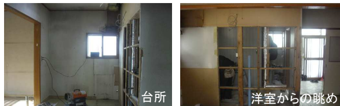
台所 洋室からの眺め