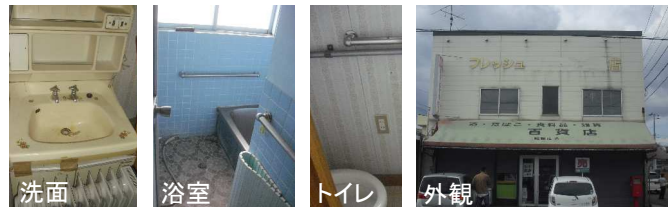
洗面 浴室 トイレ 外観