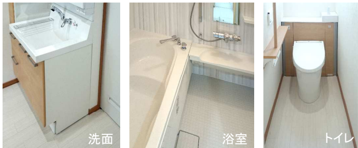
洗面 浴室 トイレ