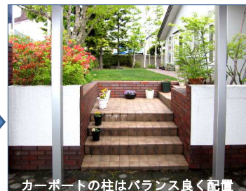
カーポートの柱はバランス良く配置