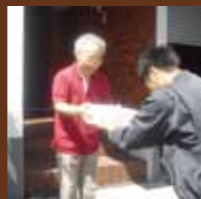
北広島市山手町K様