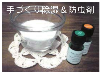
手づくり除湿&防虫剤