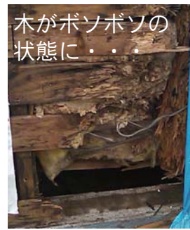
木がボソボソの状態に...

外側から見ただけではなかなか分かりづらい部分も、しっかりとメンテナンスが必要ですね。ご心配な方がいらっしゃいましたらご一報を。