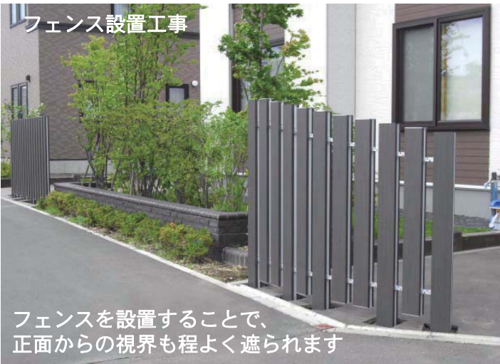
フェンス設置工事