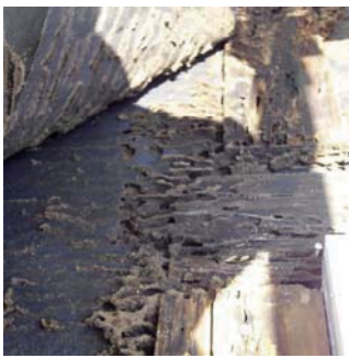
↑ 外壁の張替えの際に発覚した下地や土台部分の腐れ↓